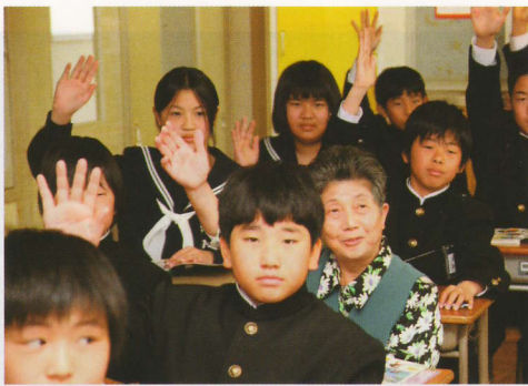
「今日がはじめての授業です。転入生気分ですね」