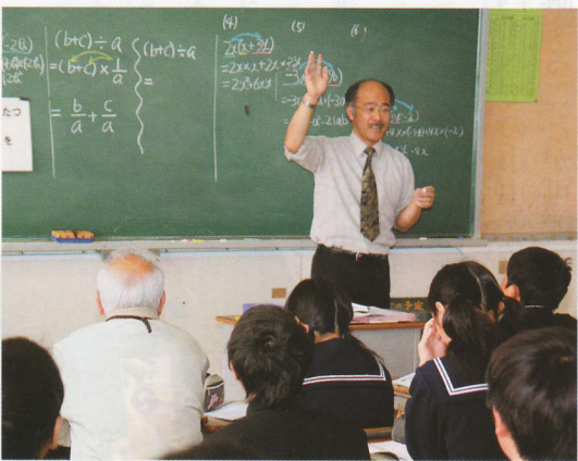
「中学生の気持ちがよく理解できるようになりました」