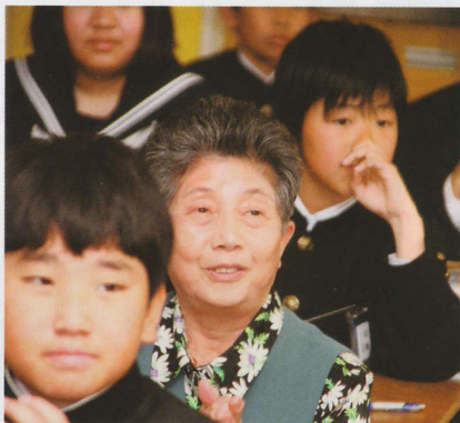
「一度英会話の授業を受けてみたかったんです」