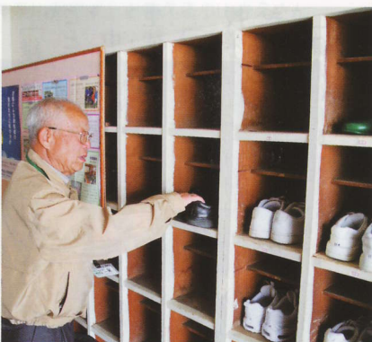
「男子生徒の中では私の靴が一番小さいかな」