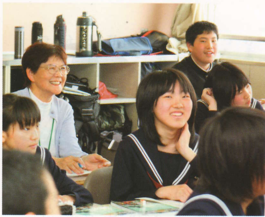
教科は何科目でも、聴講生が自由に選択できる