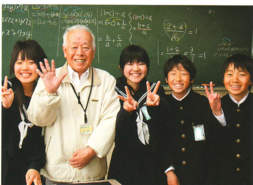
「授業も楽しいですが、子供と話すのが一番楽しみ」