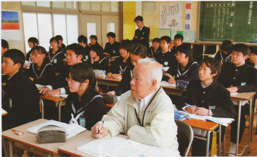
「数学は苦手。大人になって役に立つのかななんて思ってたけど、俄さんが楽しそうに授業を聞いているのを見て、私もやらなきゃと思うようになりました」と話す中学生