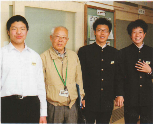
「中学生の前向きな姿勢に触れ、若返る気がします」