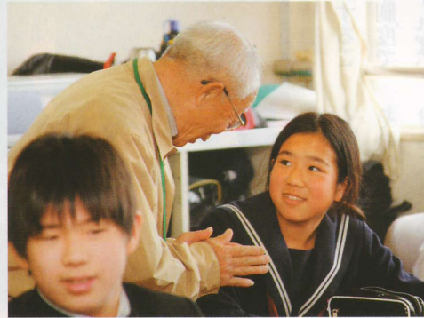
「聴講生になって4年です。子供達が1年の間にどんどん成長しているのを感じます」