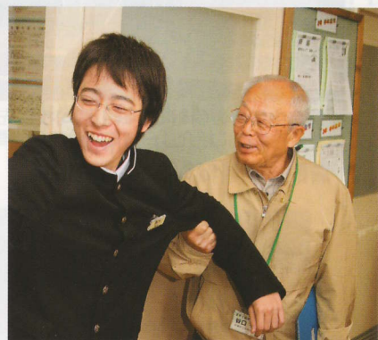
休み時間も楽しみのひとつ