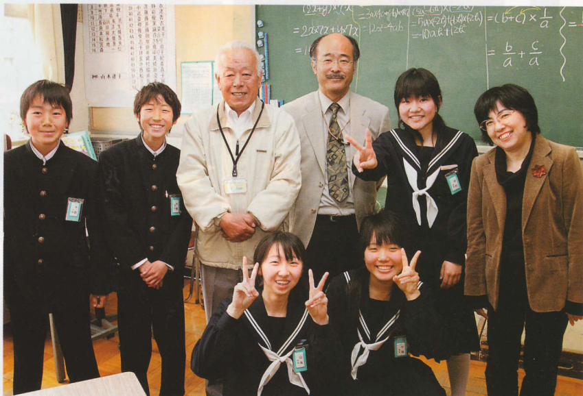
「何度か来ているうちに、皆さん自然と生徒の中でなじんでいますよ」と話す数学の先生