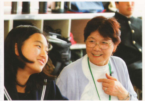
「どこまで進んだんだっけ?」「ここだと思うわよ」