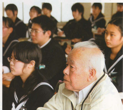
聴講生も生徒と同じようにテストを受ける